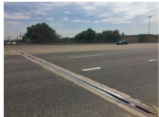
Sheridan Boulevard sobre Clear Creek