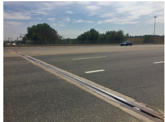
Sheridan Boulevard over Clear Creek