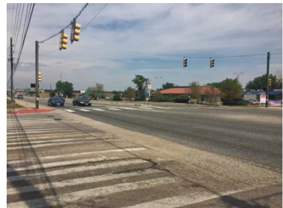
Sheridan Boulevard y la Avenida 53

Si tiene dudas o inquietudes, llame a la línea de información del proyecto al 303-802-6101 o envíe un correo electrónico a: co95sheridan@gmail.com . En el sitio web del proyecto encontrará más información, www.codot.gov/projects/sheridan-boulevard-52nd-58th-resurfacing . Para ser agregado a la lista de notificación del proyecto, envíe una solicitud a la dirección de correo electrónico anterior.