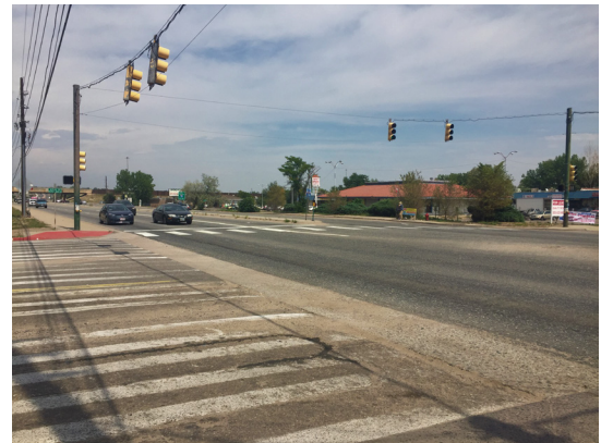
Sheridan Boulevard at 53 rd Avenue

If you have questions or concerns, call the project information line at 303-802-6101 or send an email to: co95sheridan@gmail.com . More information is available on the project website, www.codot.gov/projects/sheridan-boulevard-52nd-58th-resurfacing . To be added to the project notification list, please send a request to the email address above.